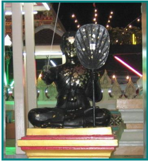
ปฏิมารูปพระมาลัยหน้าพระเจดีย์จุฬามณี