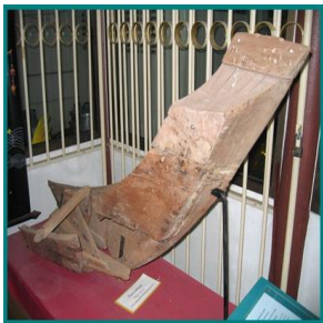
โขนเรือกราบกันยญา แต่เดิมลำเรือมีสภาพสมบูรณ์กว่านี้มาก แต่เป็นที่น่าเสียดาย เนื่องจากประวัติความเป็นมาค่อย ๆ ลบเลือนไปตามกาลเวลา มีแต่เพียงกำบอกเล่าต่อ ๆ กันมา ไม่ได้มีการจดบันทึกไว้เป็นลายลักษณ์อักษร จึงไม่มีผู้ใดทราบความสำคัญ และเก็บรักษาไว้ให้ดีแต่ต้น