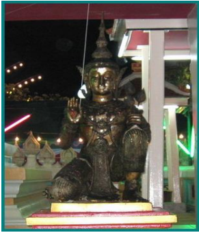
ปฏิมารูปพระโพธิสัตว์ศรีอาริยมตไตรย์ หน้าพระเจดีย์จุฬามณี