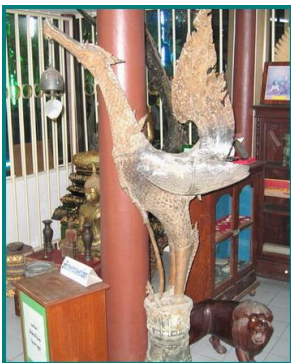
หงส์สำริด ที่ใช้ประดับมุมสระน้ำโบราณหน้าวัด ซึ่งปัจจุบันสระถูกถมไปจนหมดสิ้น ส่วนหงส์สำริดนี้ เป็นเพียง 1 ใน 4 ที่ตามกลับมาได้จากการถูกโจรกรรม