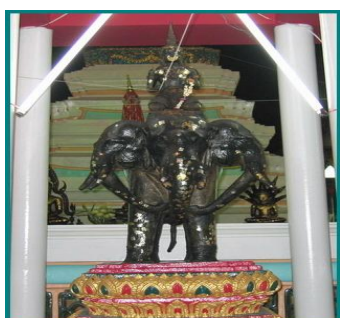
ปฏิมารูปพระอินทร์ทรงช้างเอราวัณ หน้าพระเจดีย์จุฬามณี