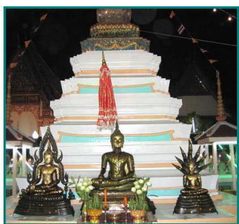
พระเจดีย์จุฬามณีหน้าพระอุโบสถ ที่ได้รับการบูรณะ เนื่องจากของเดิมปรักหักพัง และโดนโจรผู้ร้ายปล้นเอาสิ่งของมีค่าภายในไปมากมาย